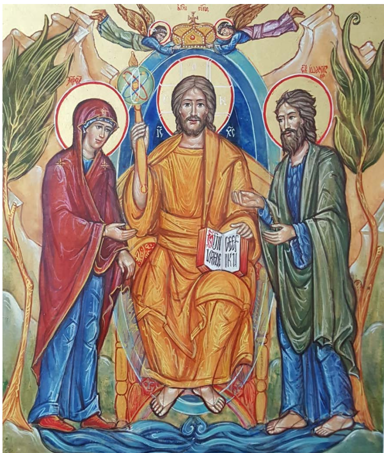
Jezus op de troon

Wanneer de Mensenzoon komt in zijn heerlijkheid en vergezeld van alle engelen, dan zal Hij plaatsnemen op zijn troon van glorie (Matteüs 25,31).