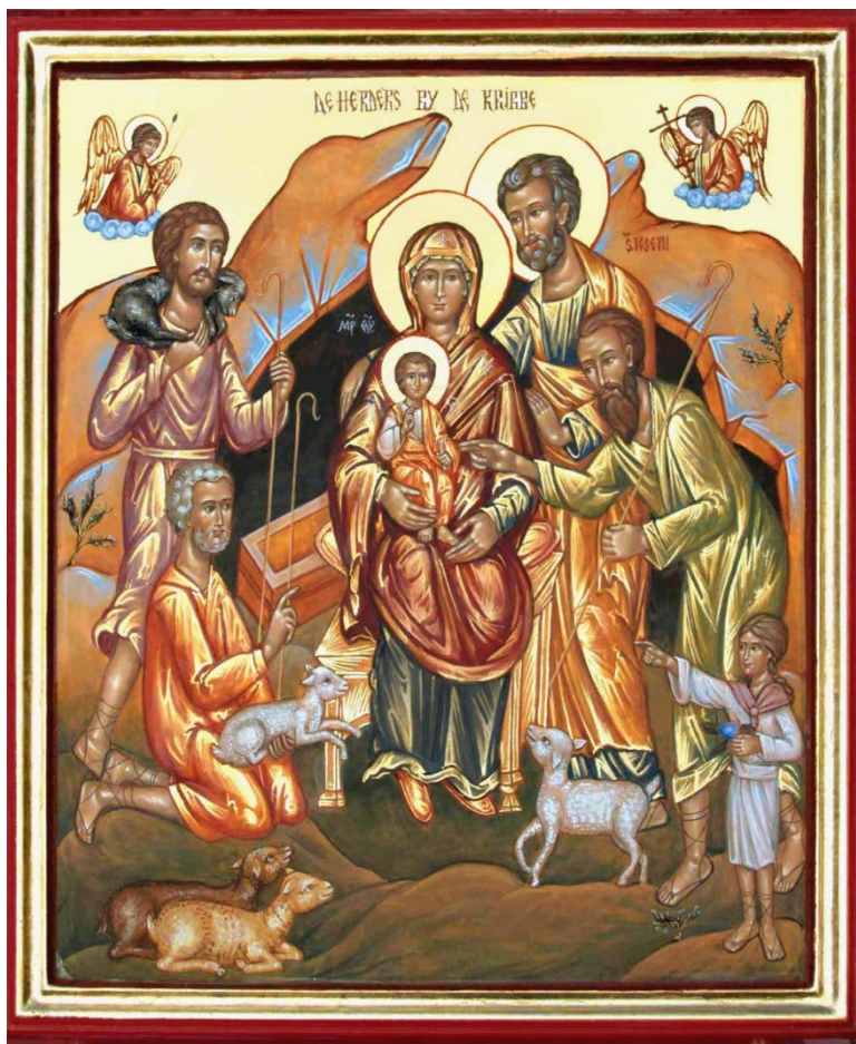
De herders bij het Christuskind.

Zij verheerlijkten God met de woorden: 'Eer aan God in den hoge en op aarde vrede onder de mensen' (Lucas 2,13-14).