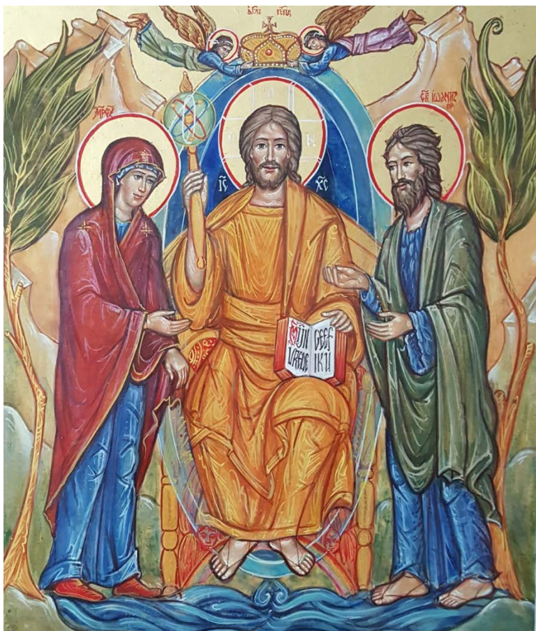
Hesus riba su trono

Ora Yu di hende bini den su gloria, huntu ku tur su angelnan, lo E sinta riba su trono glorioso (Mateo 25:31)